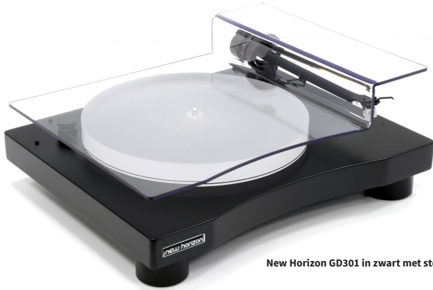
New Horizon GD301 in zwart met stofkap