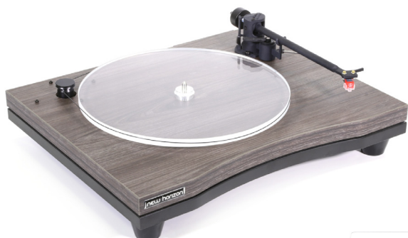
New Horizon GD190 in donker hout

Model 190 is gelijk aan Model 129 echter met twee van elkaar ontkoppelde sokkels. De onderste sokkel is voorzien van een zwart houtpatroon. De bovenste sokkel is uitgevoerd in verschillende afwerkingen en naar keuze in licht hout, donker hout of zwart hout patroon. Beide modellen meten 450 x 365 mm (bxh) en worden geleverd inclusief stofkap. Wordt geleverd zonder element.