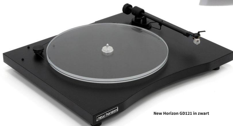
New Horizon GD121 in zwart