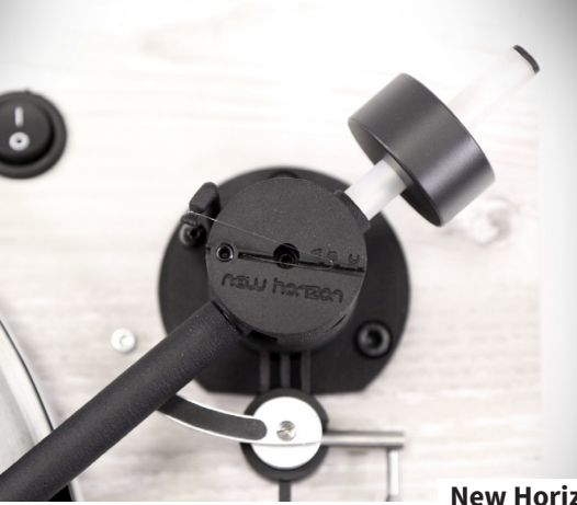
New Horizon GD129