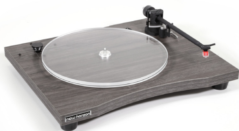
New Horizon GD129 in donker hout