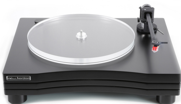
New Horizon GD203 in zwart

Alle modellen in de 200 Series worden zoals gezegd geleverd met de uitgebreid instelbare 9 inch NH95 toonarm, gemaakt van Alumide®. Een extra contragewicht maakt toepassing van nagenoeg alle gangbare elementen mogelijk en wordt als standaard bijgeleverd. Optioneel en met groot voordeel zijn alle modellen in de Series 200 verkrijgbaar met een Ortofon 2M Red of 2M Blue element, hetgeen al deze modellen het predicaat Plug & Play geeft. Deze draaitafels worden in ovengeharde mat witte en mat zwarte lakuitvoering geleverd. Wordt geleverd zonder element.