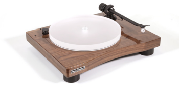
New Horizon GD301 in Walnoot