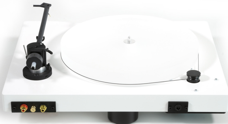
New Horizon GD301 in wit achterzijde