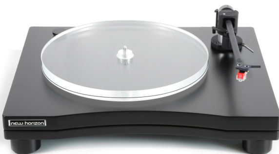
New Horizon GD202 in zwart