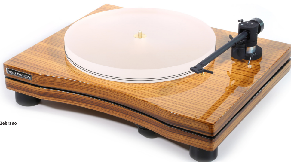
New Horizon GDS II in hoogglans Zebrano