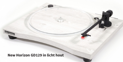
New Horizon GD129 in licht hout