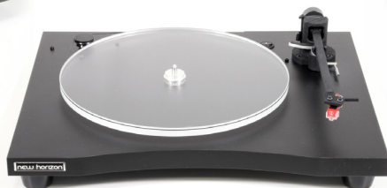
New Horizon GD129 in zwart