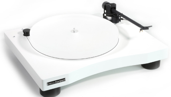
New Horizon GD301 in wit