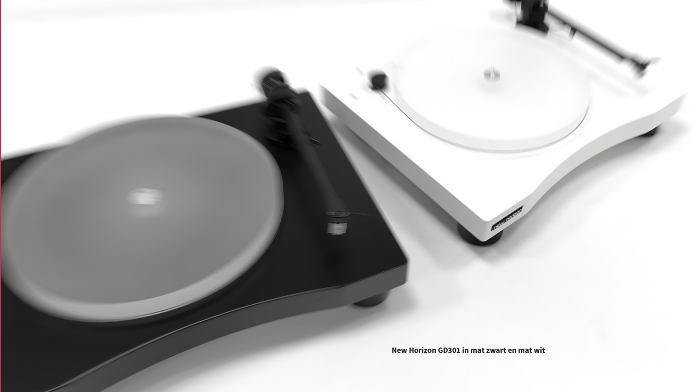
New Horizon GD301 in mat zwart en mat wit