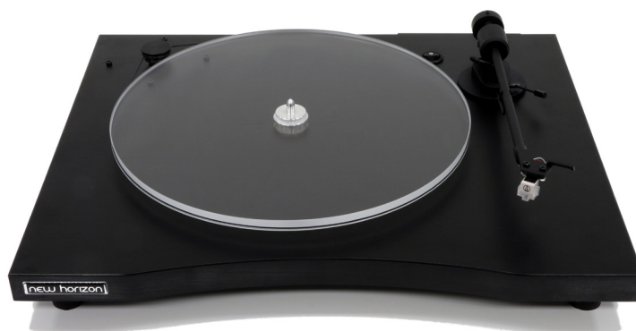
New Horizon GD101 in zwart

Dit Italiaanse merk verstaat als geen ander de kunst om een bijna ongeloofwaardige hoeveelheid kwaliteit voor het geld te bieden. Wat dacht je bijvoorbeeld van een omgekeerd precisielager in alle modellen. Het instapmodel, de GD101 is helemaal Plug & Play. Zo, hup uit de doos, een plaat erop en draaien maar. Uiterlijk verschilt dit model maar weinig van de modellen die erboven gepositioneerd zijn. Voor slechts 499 euro krijg je een 8,6 inch aluminium toonarm, compleet geleverd met voorgemonteerd en afgeregeld Audio Technica AT91R MM element. De stijlvol vormgegeven behuizing is een enkele 25 mm hoge zwart gelamineerde sokkel van resonantie-arm hout. De sokkel is uitgevoerd met drie brede, massieve, stelvoeten van natuurrubber wat stabiele en loodrechte opstelling op elk oppervlak mogelijk maakt. De 10 mm hoge transparante (acryl) draaischijf weegt een respectabele 850 gram en is voorzien van een groef die aflopen van de snaar onmogelijk maakt. De aandrijving geschiedt middels een AC synchroonmotor die de noodzakelijke energie via een ronde siliconen snaar naar de draaischijf overbrengt. Om te wisselen van 33 naar 45 tpm volstaat het simpelweg omleggen van de snaar. De ont koppeling van de motor wordt met vier afgestemde veren bereikt. De GD101 meet 450 x 365 mm (bxd) en wordt geleverd inclusief stofkap. De GD101 is tegen een geringe meerprijs verkrijgbaar met een 12 mm hoge en 1050 gram zware draaischijf en heet dan GD121.