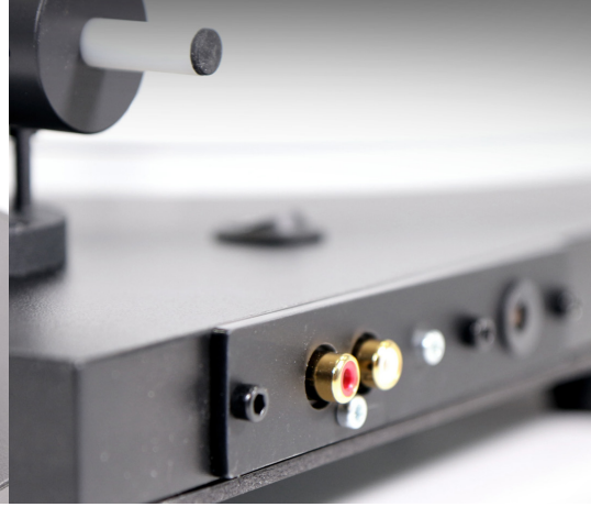
New Horizon GD190