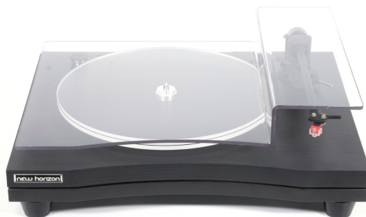
New Horizon GD190 in zwart