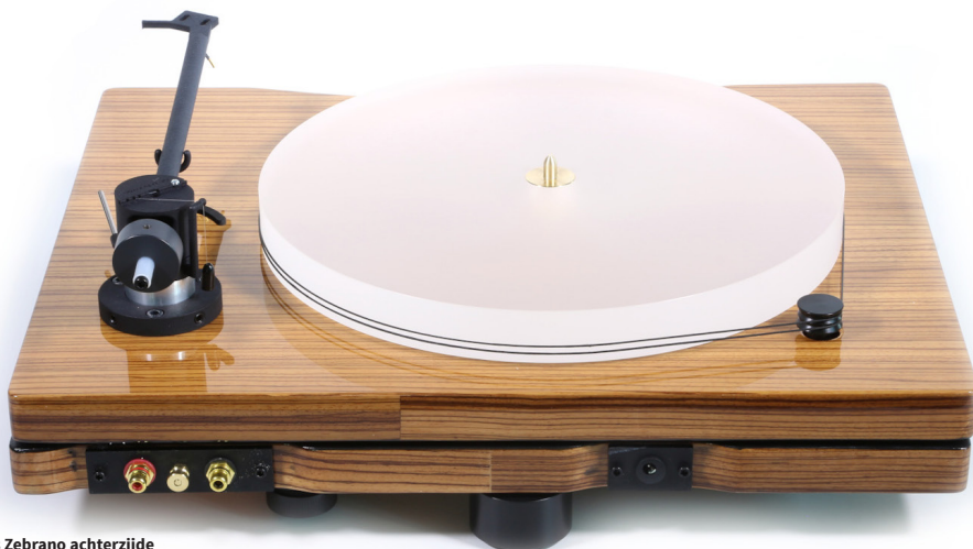
New Horizon GDS II in hoogglans Zebrano achterzijde