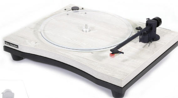
New Horizon GD190 in licht hout