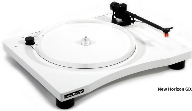
New Horizon GD201 in wit