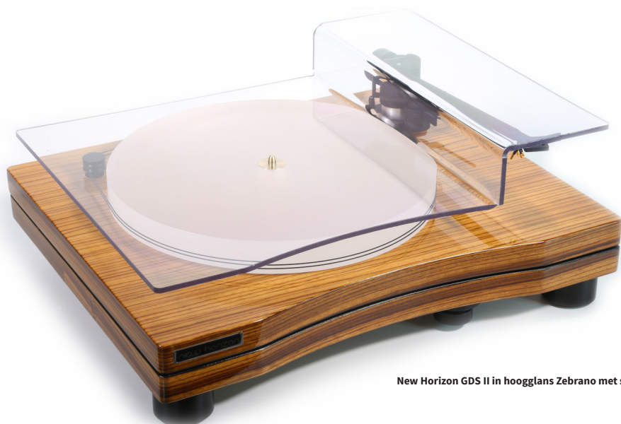
New Horizon GDS II in hoogglans Zebrano met stofkap