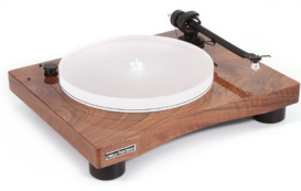
New Horizon GD301 in Redwood