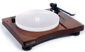
New Horizon GD301 in Wengé