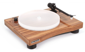
New Horizon GD301 in Zebrano